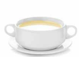
Speisen (z.B. Suppe/Bouillon)